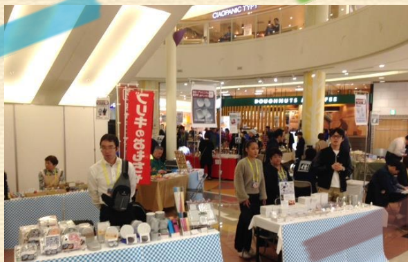
会場風景、町工場の皆さまがお客様をお迎え