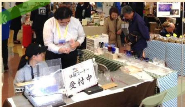
人気のガラス細工体験コーナー 普段体験できないことにお子様興味津々